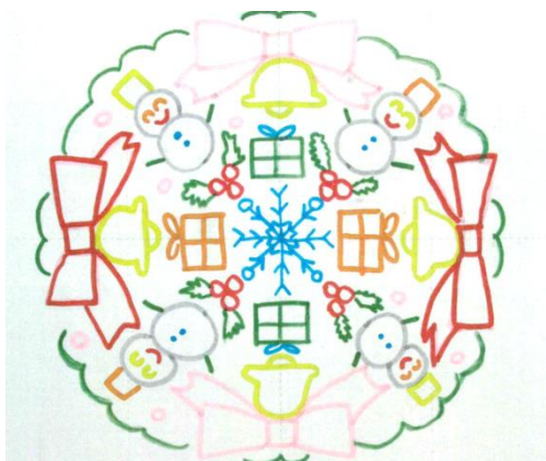
優秀賞：わくわくリースでにっこり☆

うみなかクリスマスキャンドルナイトは、今年で 16 回目を数えます（2007 年より開催）。今年は 172 作品の応募があり、どの作品もすばらしく審査は大変難航しましたが、その中から選ばれた最優秀賞『クジャクと一緒にハッピークリスマス』を公園内の野外劇場に描きます（縦横 100m 四方）。7 色の紙袋の中にキャンドルを灯してデザインを表現します。下記の優秀賞 2 点のほか、計 15 点が入賞作品として選ばれました。