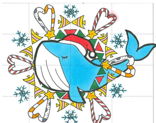
優秀賞：Very Merry Happy Christmas