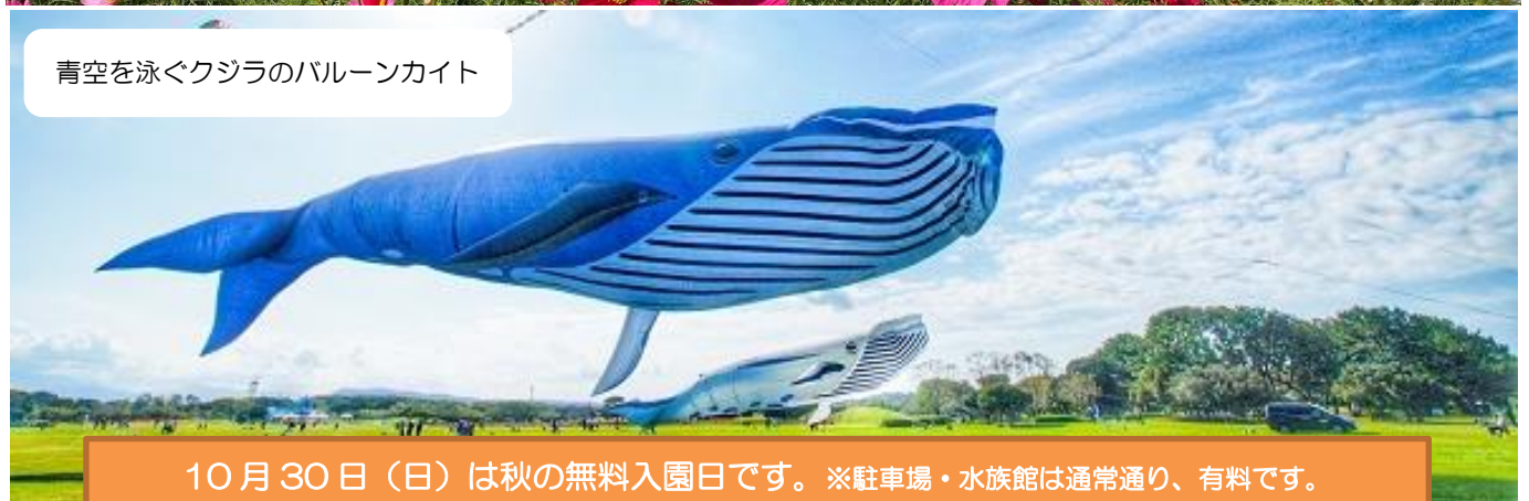
青空を泳ぐクジラのバルーンカイト