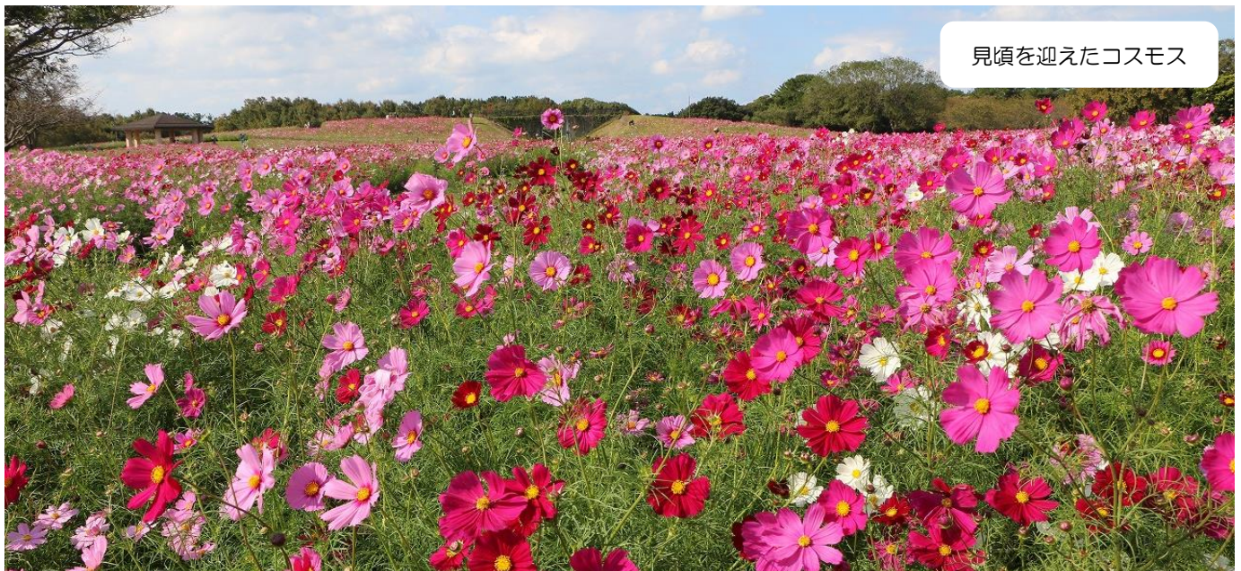
見頃を迎えたコスモス