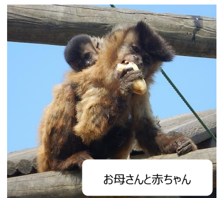
お母さんと赤ちゃん