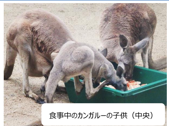
食事中的カンガルーの子供（中央）

6月24日現在、2頭の赤ちゃんを確認しています。2016年以来5年ぶりの赤ちゃんです。