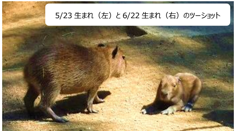
5/23 生まれ（左）と6/22 生まれ（右）のツーショット