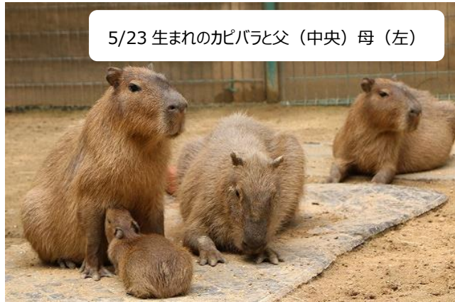
5/23 生まれのカピバラと父（中央）母（左）

5月23日に、2015年以来6年ぶりとなる待望のカピバラベビーが生まれました。すくすくと育ち、母乳だけでなく大人たちに混ざって、キャベツやニンジン、ジャガイモなどの野菜も食べています。さらに6月22日にも妊娠していた個体が出産しカピバラエリアは大盛り上がりです。