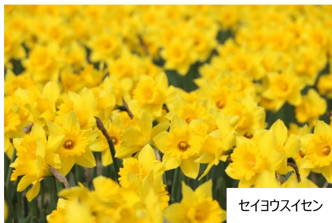
セイヨウスイセン