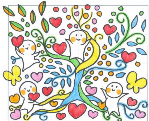
優秀作品②：育てる、安心する未来の樹