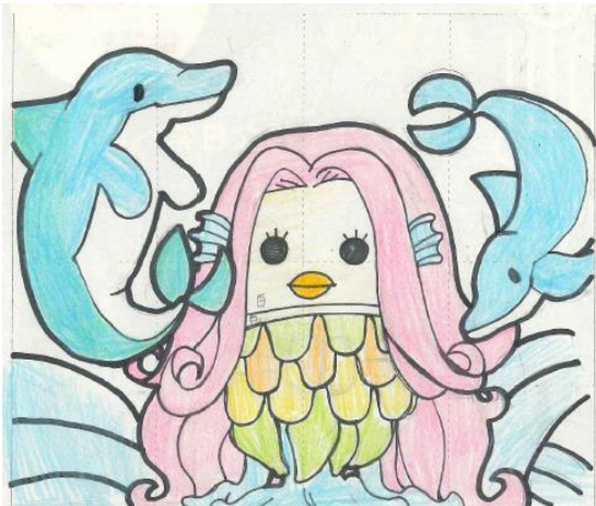
優秀作品①：コロナが終息しますように

今年は、219 作品と多くの応募があり、どの作品も力作ぞろいで、審査も大変難航しましたが、その中から選ばれた最優秀賞作品「明るい未来」を公園内の野外劇場に、縦横 100m 四方の大きなサイズで描きます。7 色の紙袋を使用して表現します。下記の優秀賞 2 点のほか、計 11 点が入賞作品として選ばれました。