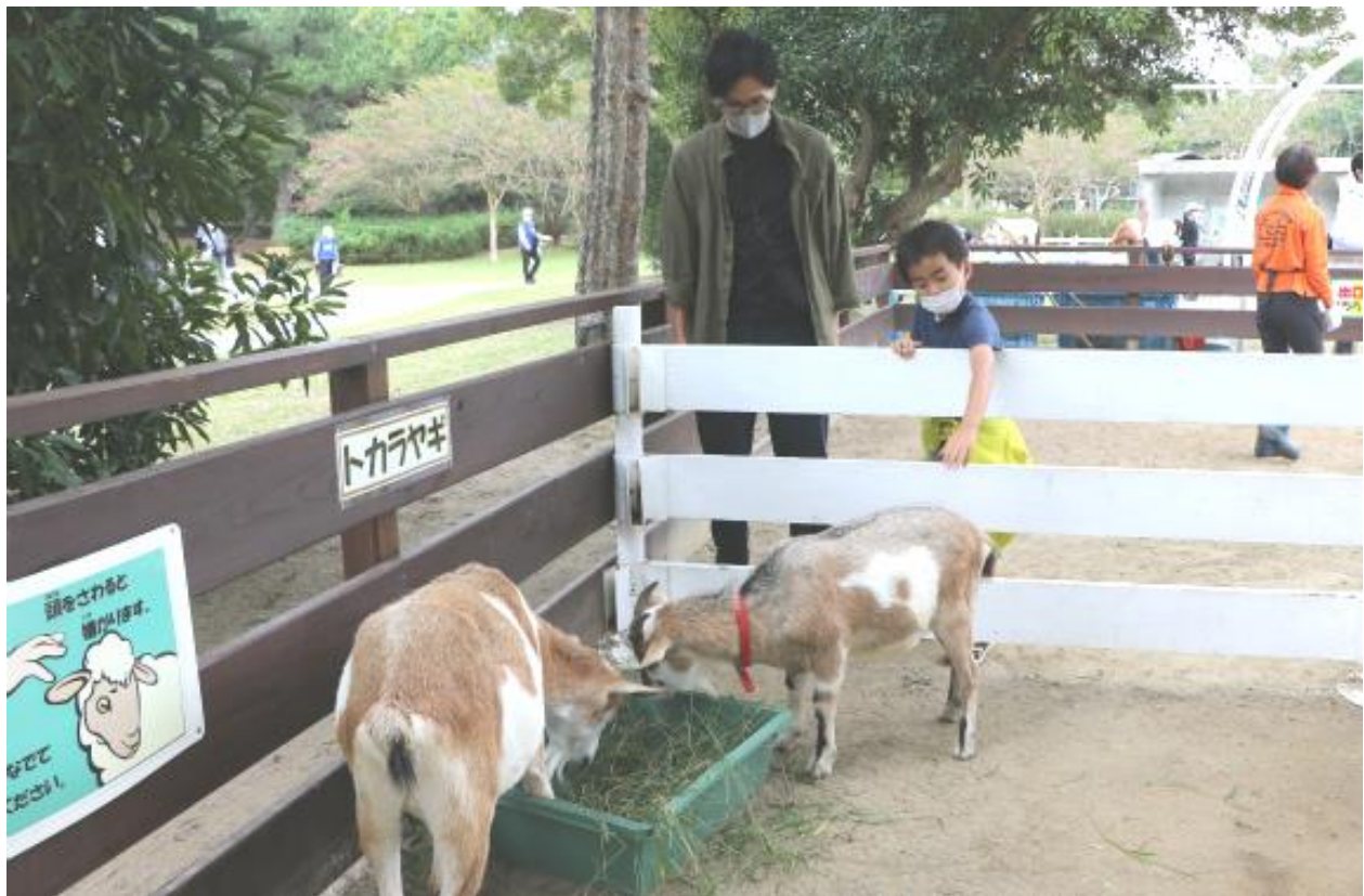
動物ふれあい広場の様子（2020年10月11日撮影）

ご多忙中のことは存じますが、取材ならびに記事掲載のほどよろしくお願い申し上げます。