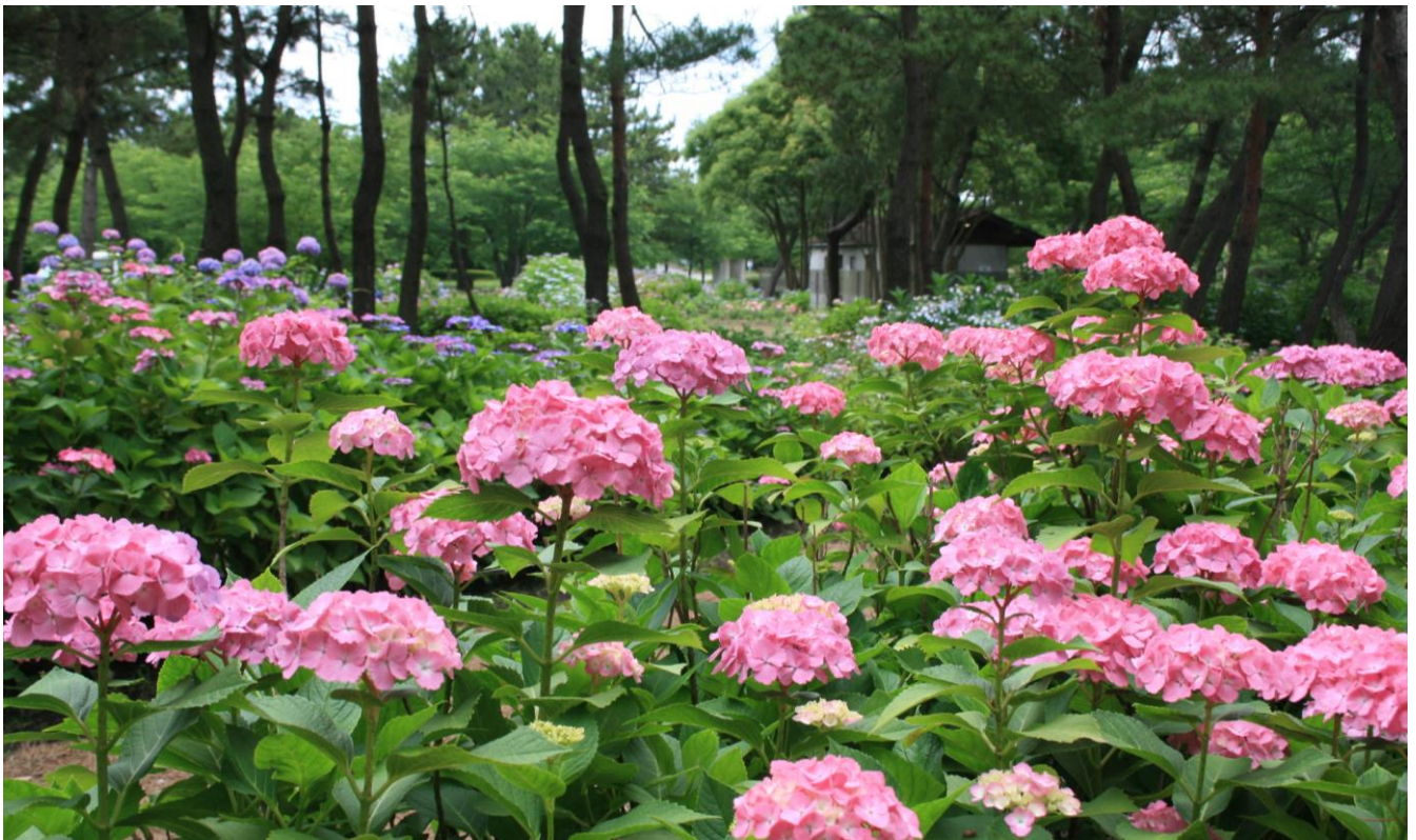
過去のアジサイの様子

ご多忙中のこととは存じますが、取材ならびに記事掲載のほどよろしくお願いいたします。