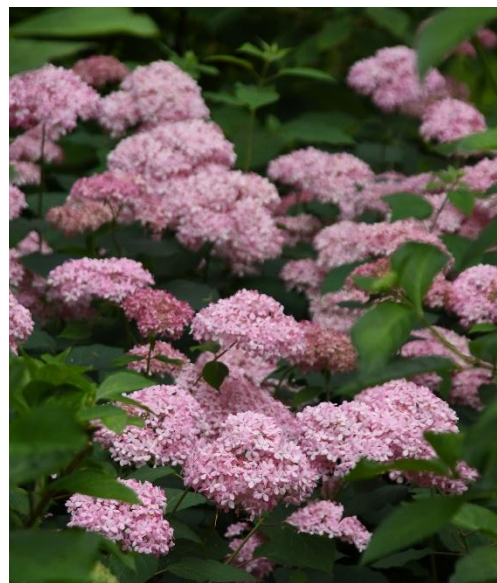
アジサイ・白とピンクのアナベル（花木園展示棟前 6/13 撮影）

国営昭和記念公園（立川市・昭島市）では、純白のアジサイ“アナベル”が美しく優雅に咲いています。見頃を迎えたアナベルは、丸みを帯びてふんわり可愛らしい姿に。一つひとつの花が小さく、レースのような風合いが人気です。アナベルの群生は「花木園展示棟前」と、ふれあい橋西側の脇道「アジサイロード入口付近」の2か所でお楽しみいただけます。また、柔らかな色合いが魅力のピンクアナベルの可愛らしい花姿もご覧ください。ぜひ、取材・記事掲載のほどよろしくお願ひ申し上げます。