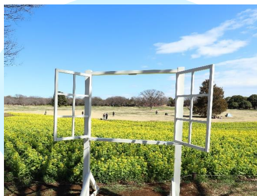
フォトスポット 白い窓から見える景色 (3/2 撮影)

お問合わせ 国営昭和記念公園 国営昭和記念公園管理センター 企画グループ 広報チーム：林・黒岩・原島