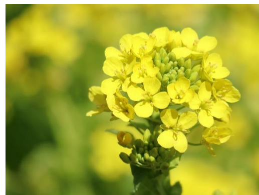
たくさんの花が付きます (3/2 撮影)

◆現在背丈が40cmほどです。上向きに咲いているので上からのアングル、または、かがんで青空との撮影もおすすめです。