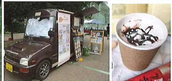
珈琲のケータリングカー