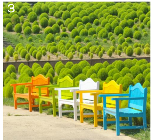
1. 花巡りの丘の6千本のコキア 2. 現在高さ約70cm 3. なついろベンチ（花巡りの丘）※2024年8月18日撮影