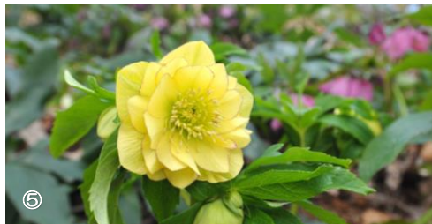
①ニホンズイセン見頃（竜頭の森：2万本）②ウメ見頃（花巡りの丘・ドッグラン近く：120本） ③～⑤クリスマスローズ見頃（竜頭の森：3,000本）（2024年2月15日～18日撮影）