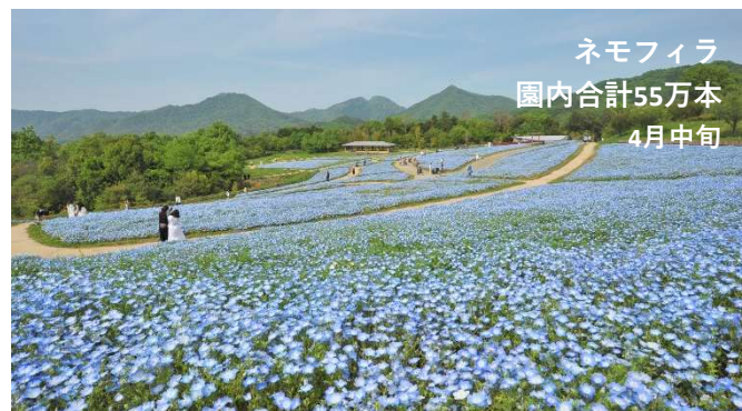
ネモフィラ 園内合計55万本 4月中旬

詳細は、自然生態園（tel.0877-79-1807）までお問い合わせください。