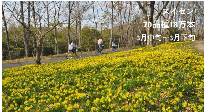
スイセン 70品種18万本 3月中旬～3月下旬

期間中はスイセンやサクラ、チューリップ、ネモフィラなど、春の花々がバトンを繋ぐように次々と開花していきます。春の暖かな陽気のもと各種イベントも開催予定。