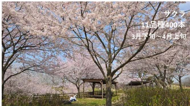
サクラ 11品種400本 3月下旬～4月上旬