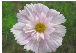
コスモス “カップケーキブラッシュ”