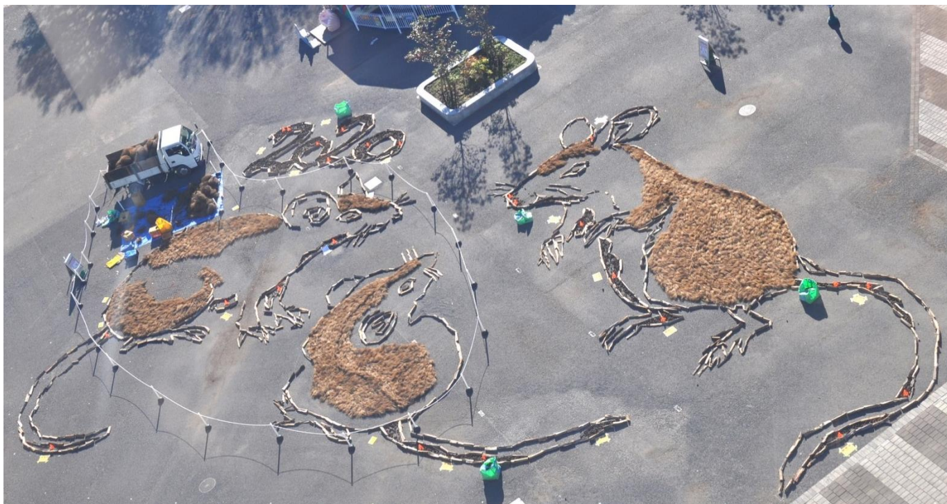
観覧車から撮影した巨大地上絵 (2019年12月4日撮影)

国営ひたち海浜公園では、年末年始の風物詩「干支の巨大地上絵」がまもなく完成します。今回は、来年の干支「子(ねずみ)」が三匹で寄り添う姿を表現。「ねずみ」は福をもたらすとされ、「三」は「満つ」とも読め縁起の良い数字とされることから、幸せに満たされる一年となるようにと願いを込めました。現在はお客様にもご参加いただきながら仕上げを行っており、12月6日(金)に完成し、翌7日(土)より公開します。