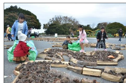
仕上げの風景 (2018年12月2日撮影)

■開催期間／2019年12月7日(土)～2020年1月5日(日) ※12/9、16、23、31、1/1を除く