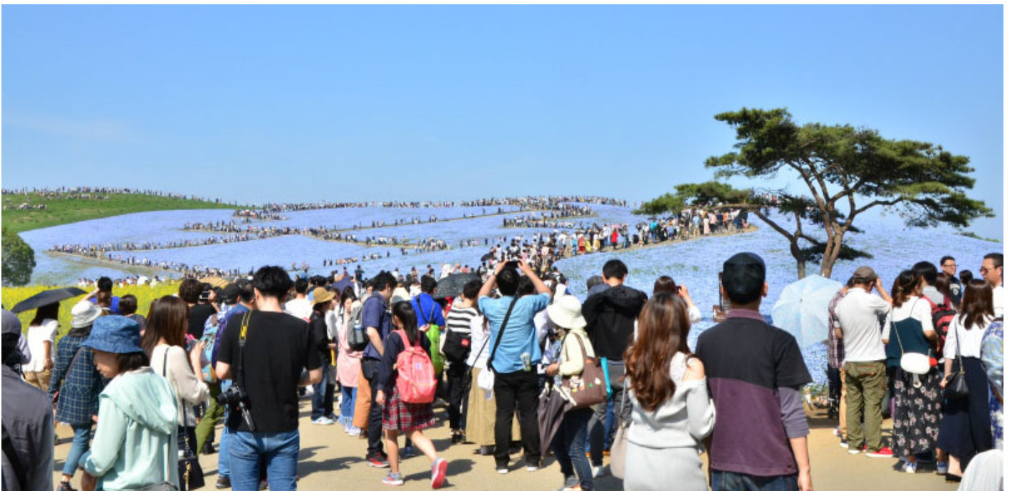
大勢の来園者で賑わうみはらしの丘 撮影/2018年4月21日

今後もお客様に満足いただけるよう努めるとともに、地元自治体や周辺施設と協力し、地域の活性化を目指して公園運営に努めてまいりますので、引き続き取材並びに記事掲載の程よろしくお願い申し上げます。