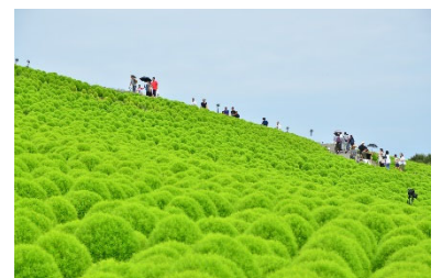
爽やかな夏の緑葉コキア(2018年8月12日撮影)

夏は、緑葉コキア、コキアライトアップの人気に加え、猛暑と中学生以下無料化の影響で水遊び広場の利用が増えたことにより、8月の入園者が43万人と2年連続過去最高を更新。秋は、適切な管理により乾燥や台風を乗り越え大株に育ったコキアの紅葉情報をきめ細やかに発信した結果、天候にも恵まれ10月は過去最高となる44万人が訪れました。