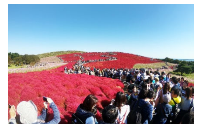
10月期一日の過去最高を記録(70,704人) (2018年10月21日撮影)