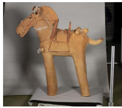
展示が予定されている装飾付器台〈大石古墳〉(写真左)、十六間筋兜〈騎西城跡・騎西城武家屋敷跡〉(同右上)、瓦塔鬼瓦〈H-G-8号窯〉(同中央下)、馬形埴輪〈下里見天神前遺跡〉(同左下)