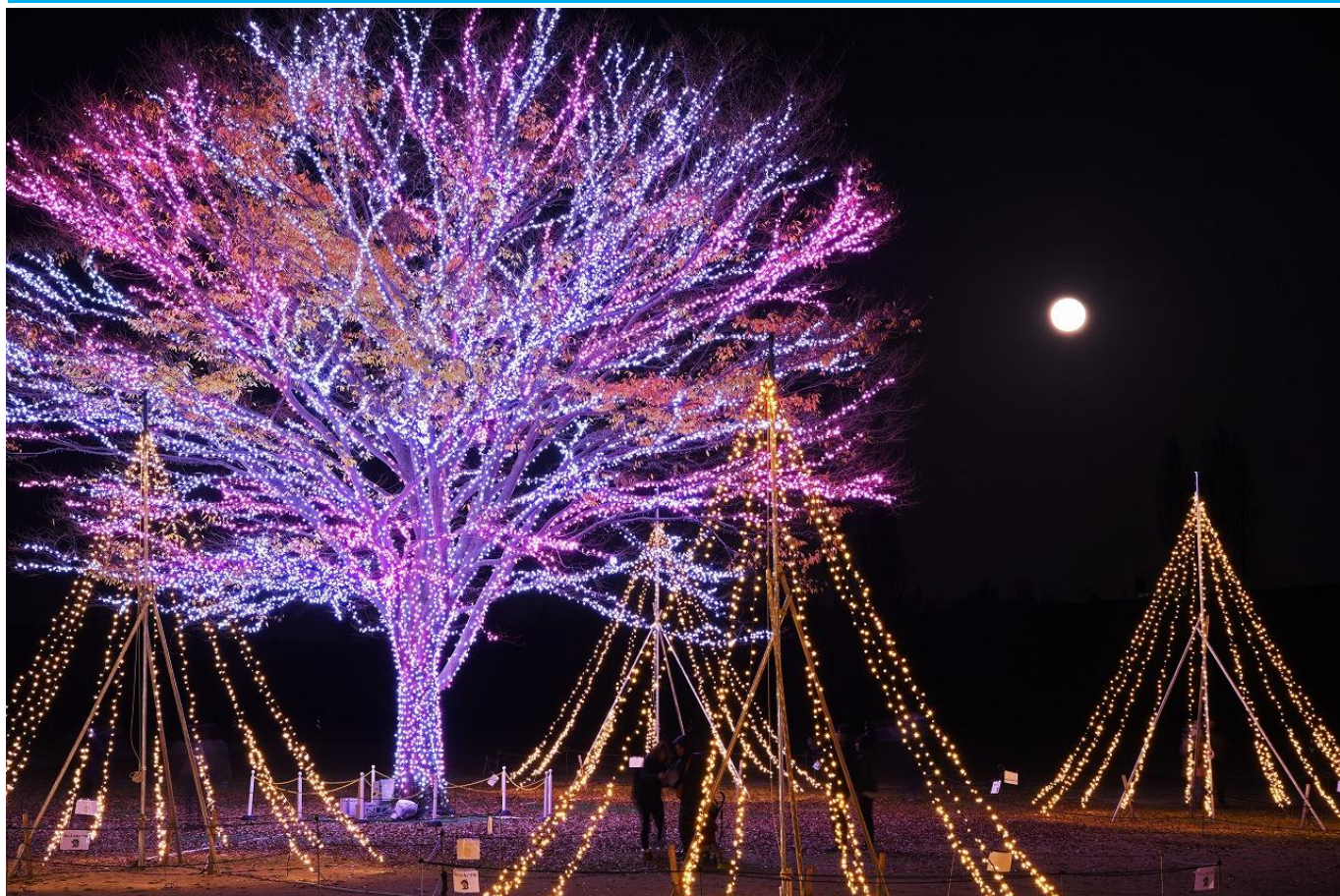
きらめきの大ケヤキ(今年の写真)