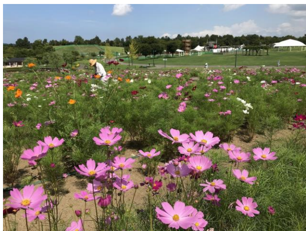
花の丘コスモス「ポニー」「ピノキオ」