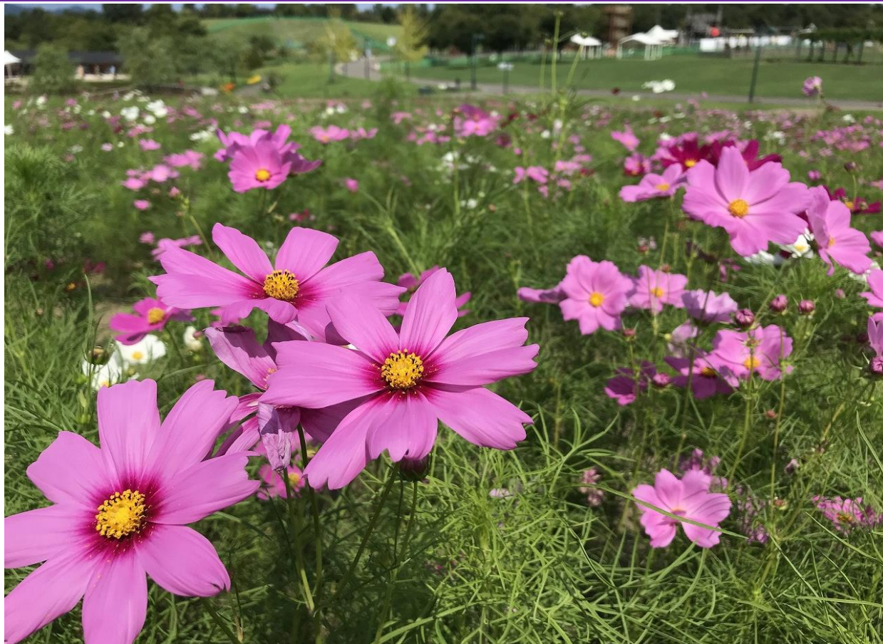
現在の開花状況 令和元年9月10日撮影