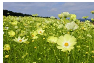
“イエローキャンパス”