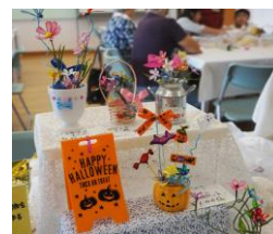
アメリカンフラワー