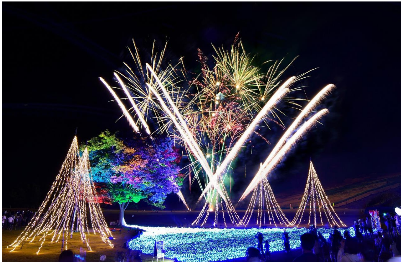
写真はイメージです。平成30年8月12日撮影