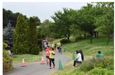
自然の中をはしる解放感!!