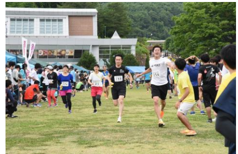
タスキでつなぐ絆のリレー

一般社団法人長岡観光コンベンション協会、JA越後ながおか、 新潟県立歴史博物館、株式会社ミツウロコプロビジョンズ