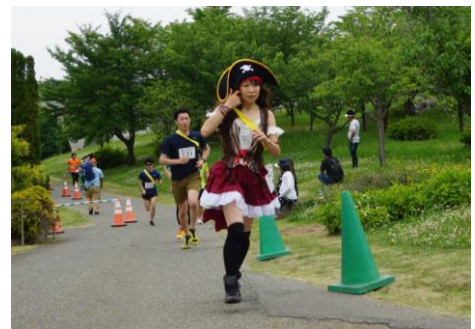
仮装など楽しみ方はそれぞれ!