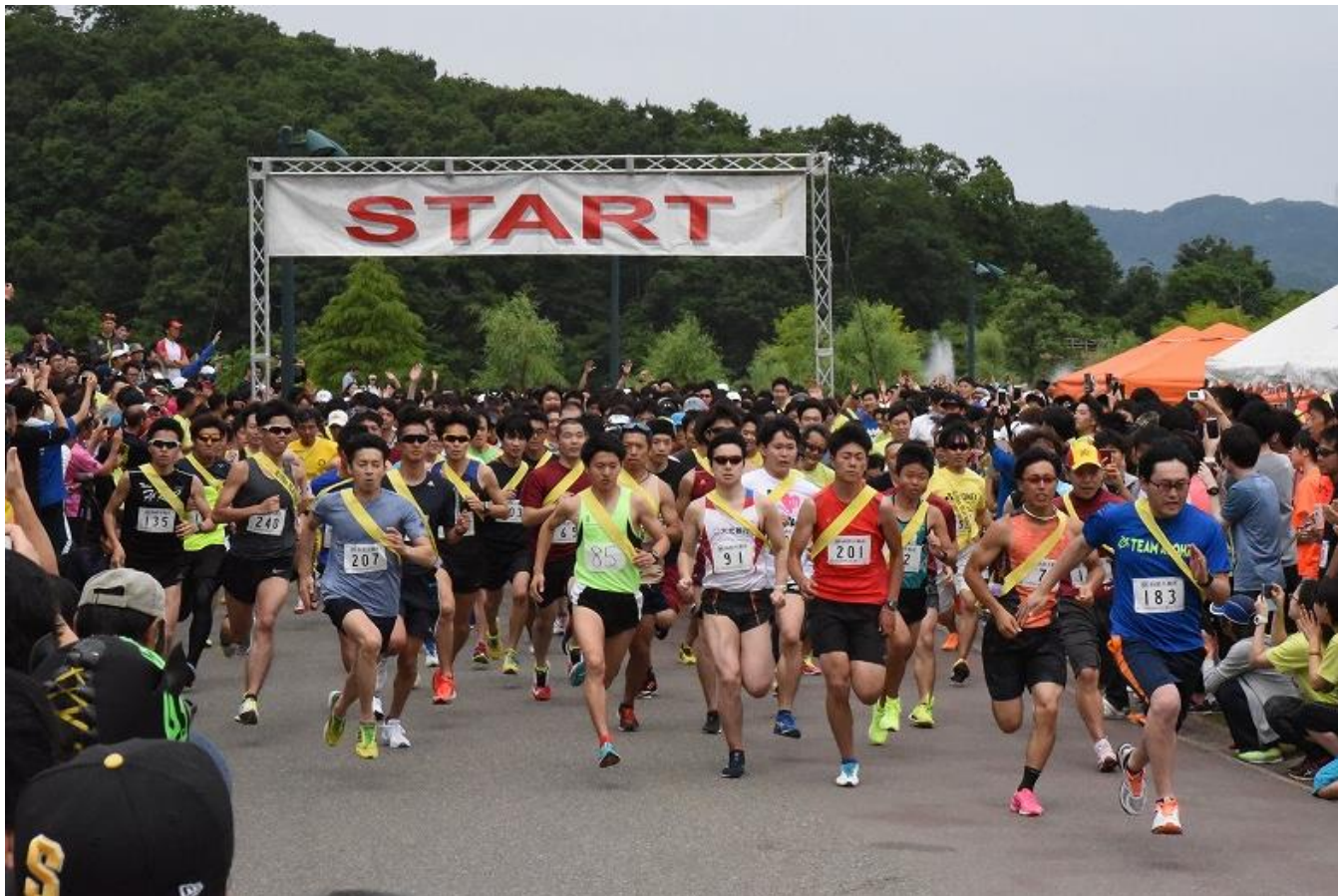
第11回大会スタートの様子 平成30年6月10日撮影

国営越後丘陵公園では、5月19日(日)に「 第12回国営越後丘陵公園リレーマラソン 」を開催します。