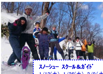
スノーシュー スクール&ガイド 1/12(土)、1/26(土)、2/9(土)

ホワイトシーズンでは、雪上競技の大会やスノーシュースクールの他、様々なスノーアクティビティイベントも目白押しです。