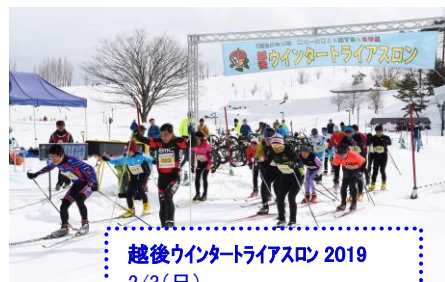
越後ウインタートライアスロン 2019 2/3(日)