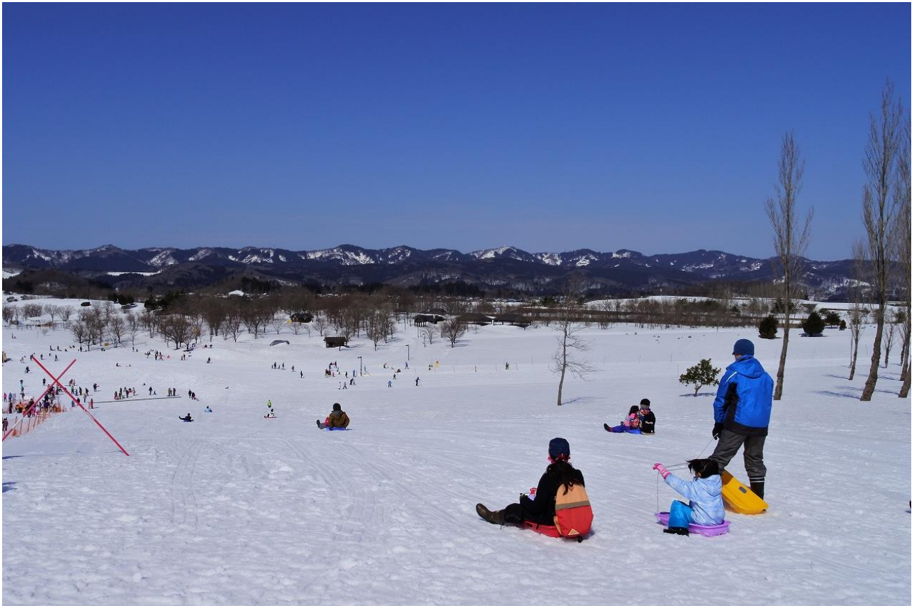
ゲレンデ利用風景 平成30年3月4日撮影