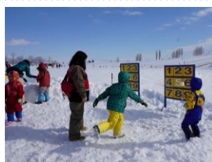
ウインターフェスタ 2/9(土)～11(月祝)

スノーモービルトレイン、雪中ゲーム大会などイベント盛りだくさんの3日間！10日にはかわいいペンギンも遊びに来るよ！