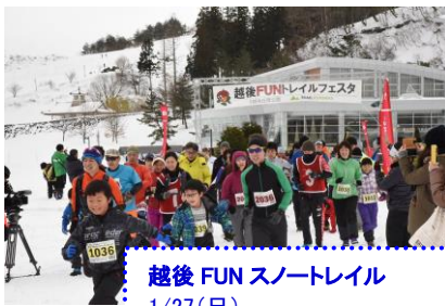
越後 FUN スノートレイル 1/27(日)