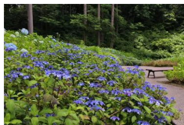
ヤマアジサイ等 16 種類の品種エリア