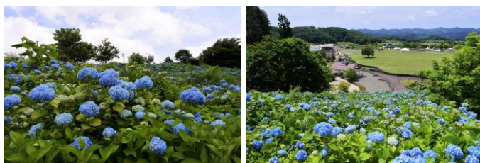
斜面一面に咲く圧巻のアジサイ