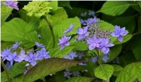
ヤマアジサイ しちだんか “七段花”