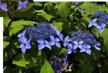
ヤマアジサイ“黒姫”