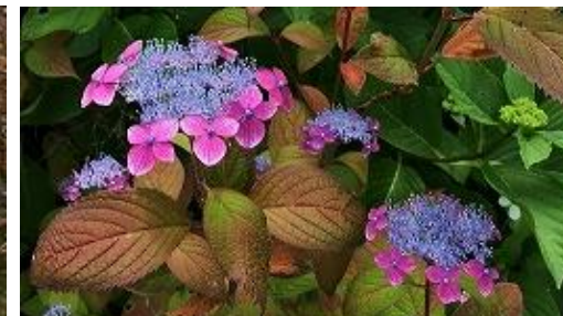
ヤマアジサイ ひゅうがこんじょう “日向紺青”