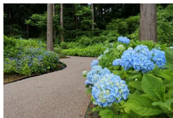
スロープもあるので車イスの方も楽しみいただけます。