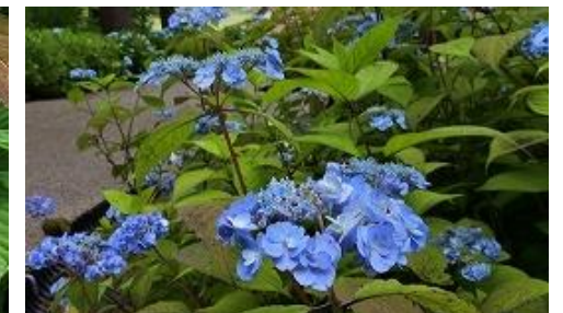
ヤマアジサイ や え あまぢや “八重甘茶”