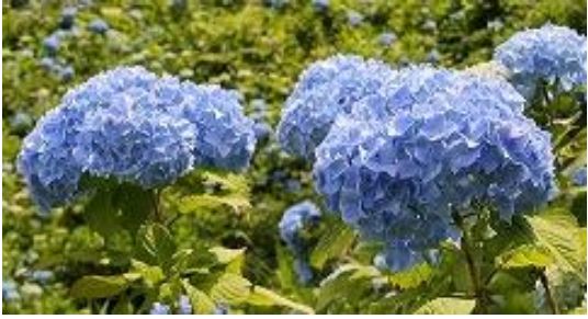
セイヨウアジサイ