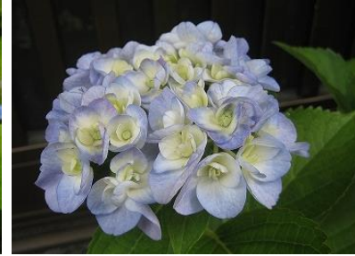
ガクアジサイ じゅうにひとえ “十二単”