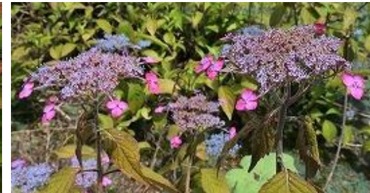
ヤマアジサイ いよ うすずみ “伊予の薄墨”