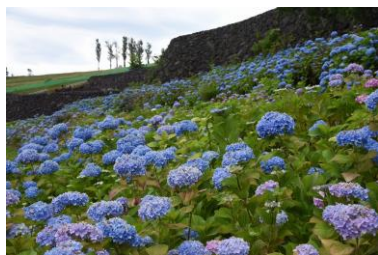
見応え十分なアジサイ大花壇！

梅雨入りして雨の多い季節、傘にあたる雨粒の音を聞きながら、アジサイを眺めるのも、日本らしい梅雨の楽しみではないでしょうか。