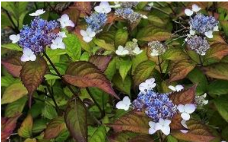
ヤマアジサイ あまぢや “甘茶”