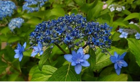
ガクアジサイ いず はな “伊豆の華”