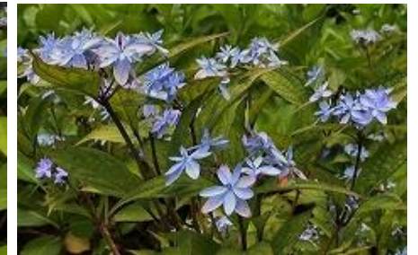
ヤマアジサイ いしづち ひかり “石鎚の光”