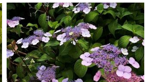
ヤマアジサイ ひめあまぢや “姫甘茶”