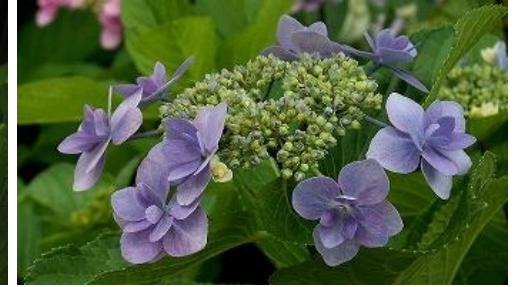
ガクアジサイ じょうがき “城ヶ崎”