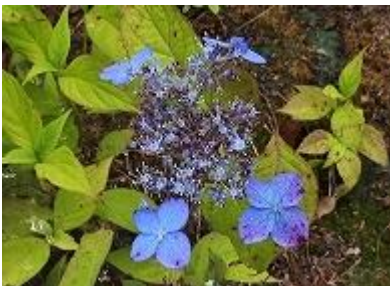
ヤマアジサイ おおにじ “大虹”