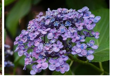
ガクアジサイ“うず紫陽花”