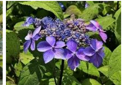
ヤマアジサイ くろひめ “黒姫”