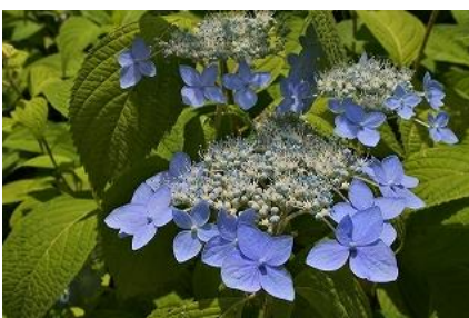
ヤマアジサイ むきしの “武蔵野”