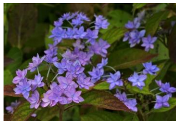
ヤマアジサイ“七段花”

アジサイの多くは土が酸性であれば「青色」になり、中性～弱アルカリ性であれば「ピンク色」になると言われています。本公園のアジサイは「青色系」が多くなっています。