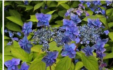
ヤマアジサイ みやま や えむらさき “深山八重紫”