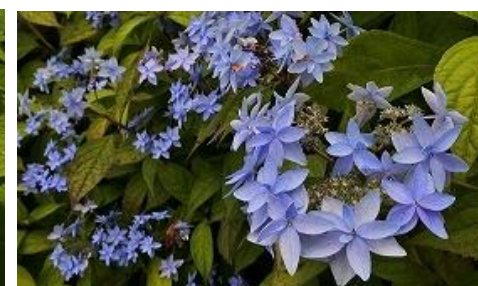
ヤマアジサイ みかた や え “美方八重”