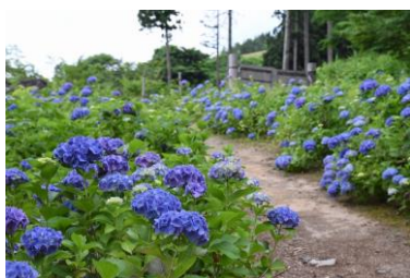
入口の両脇にはアジサイが彩ります。