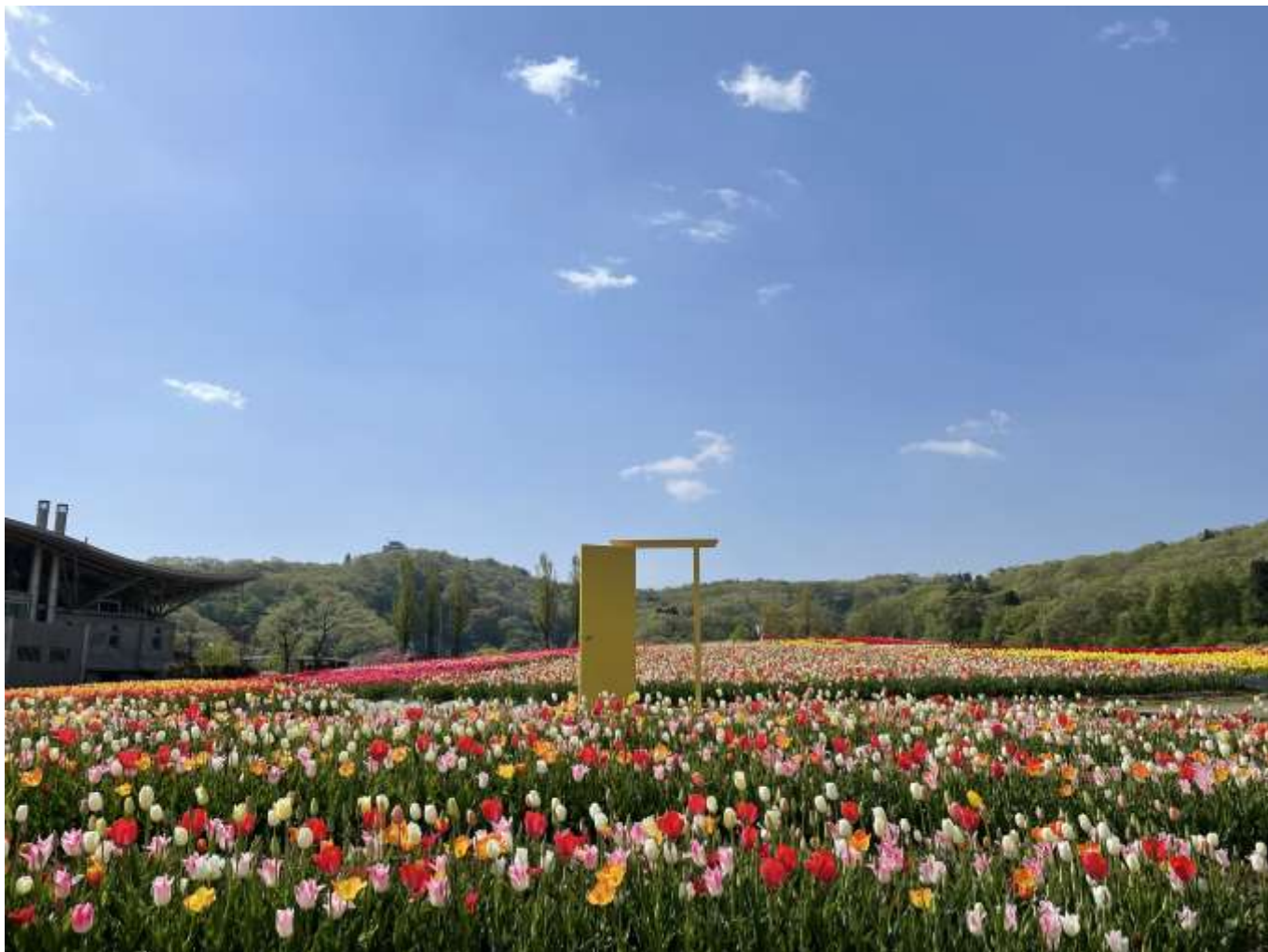
花の丘チューリップの様子（過年度撮影）

国営越後丘陵公園 令和6年度の年間イベントの日程について、別紙の通りご案内いたします。 皆様には御多忙中のことと存じますが、取材並びに記事掲載を賜りますようお願い申し上げます。