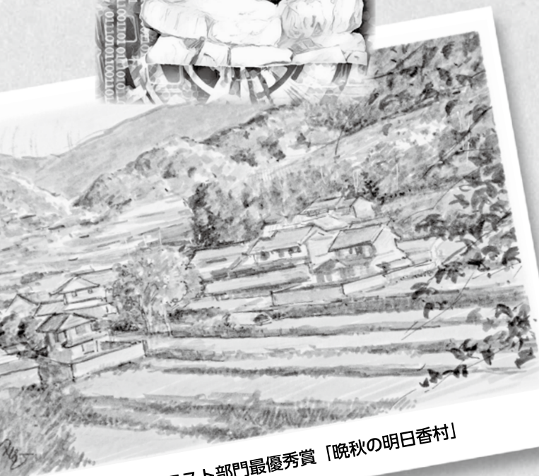
第10回イラスト部門最優秀賞「晩秋の明日香村」

「飛鳥の風景」をテーマにした『絵ハガキ』を募集いたします。飛鳥地方で見た、感じたステキな風景を「絵ハガキ」にして、たくさんの方に伝えてみませんか？