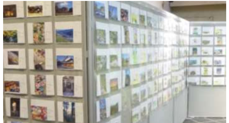
昨年度展示の様子（作品点数 182 点）

平素より国営飛鳥歴史公園の運営にご理解、ご協力を賜り厚く御礼申し上げます。 国営飛鳥歴史公園では、12月1日（月）～令和8年1月31日（土）の期間で、「飛鳥の風景」をテーマにした、『絵はがき』を募集いたします。飛鳥地方で見た、感じたステキな風景を『絵はがき』にして、たくさんの方に伝えていただきます。また、入賞作品は、ポストカードにして、受賞者授与いたします。 つきましては、ご多忙中のことと存じますが、皆様には是非取材ならびに記事掲載のほど、よろしくお願いいたします。