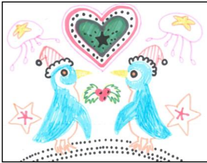
昨年の地上絵の様子（右写真）

うみなかクリスマスキャンドルナイトは、今年で、12回目を数えます。（2007年、平成19年より開催） 平成最後となる、今回のイベントでは、お隣の水族館「マリンワールド海の中道」とキャンドルアートでコラボレーションします。 「海のクリスマス」をテーマに描く地上絵が、マリンワールドにも登場します。