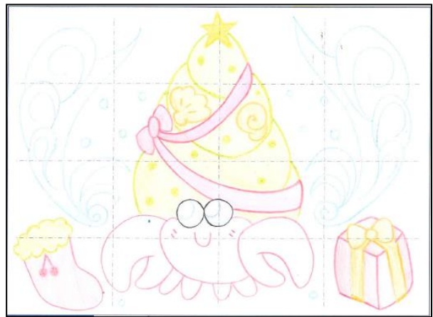
マリンワールド賞：聖夜の夢を...波に乗せて 海老原 夏季さん（高校3年生）