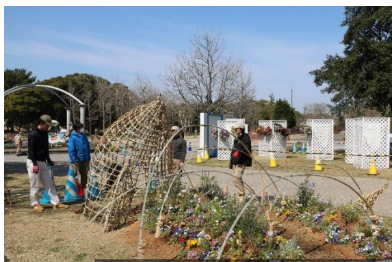
『みちびく』（製作者：ランドスケープむら）