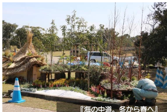
『海の中道。冬から春へ』（製作者：内山緑地建設株式会社）