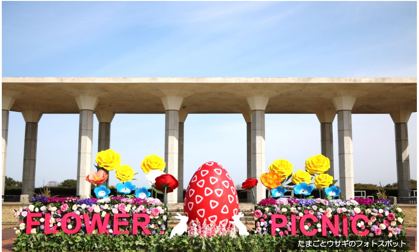
たまごとウサギのフォトスポット

いよいよ春の花の祭典「海の中道フラワーピクニック2024」が3/23(土)から始まります。イベントの開催にあわせ「お花のフォトスポット」が次々に出現♪。 イースターにちなんだ「たまごとウサギのフォトスポット」 をはじめ、全長360mのカナールには噴水との共演が楽しめる「 ピンクチューリップ花壇 」(40基・約1200球)が登場したほか、水辺には「 カラフルな赤色と黄色のチューリップ 」が咲き始めています。