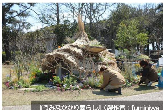
『うみなかり暮らし』（製作者：fumiwina design × マタケ造景株式会社）

造園やガーデニングなどの関連企業・団体からデザインを募集し、審査で選ばれた4花壇を展示します。SDGsをテーマに、個性と遊び心が溢れた花壇が並びます。お客様に楽しんでいただくことはもちろん、作品を通じ製作者の活動を知っていただく機会としています。ぜひ出展団体の想いと活動にもご注目ください。