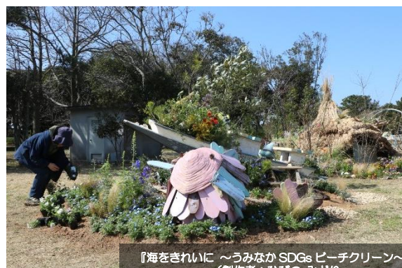
『海をきれいに ～うみなか SDGs ピーチクリーン～』（製作者：ひびのみどり（ムーングリーン+ミントデザイン室））