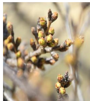
ソメイヨシノ (3.27 撮影)