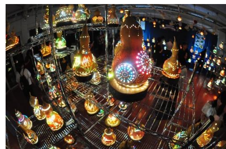
ひょうたんランプ展示（2017年8月20日撮影）

◎みはらし広場特設売店 期間／8月17日（金）～26日（日） 時間／昼も営業 11:30～21:00