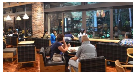
記念の森レストハウス（2017年8月20日撮影）