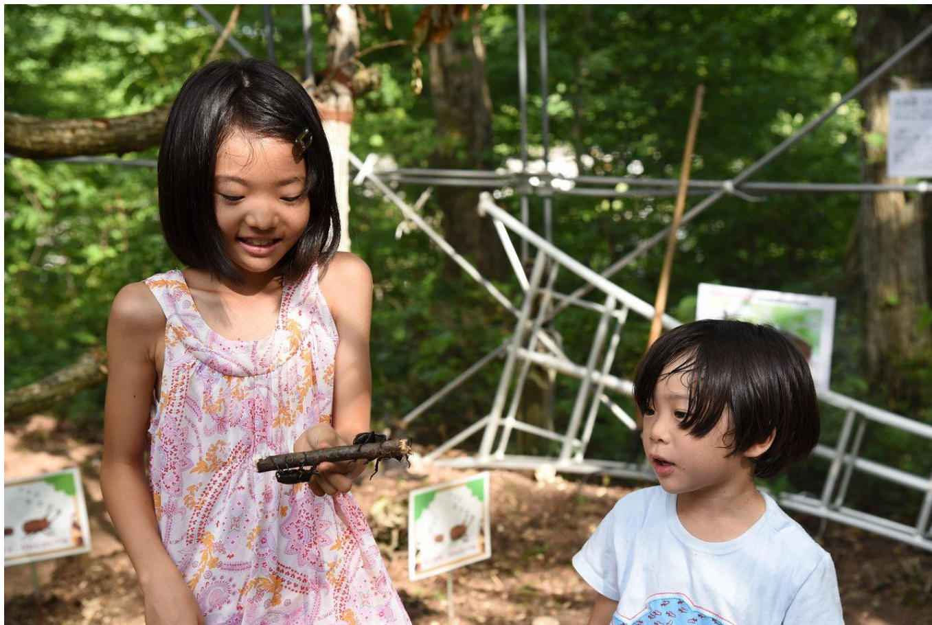
カブトムシとふれあい喜ぶ子どもたち (平成30年7月21日撮影)

国営越後丘陵公園「里山フィールドミュージアム」にて、7月21日(土)～8月16日(木)の期間、カブトムシとふれあえる カブトムシハウス をオープンしています!