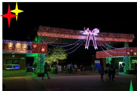
【ウェルカムゲート】