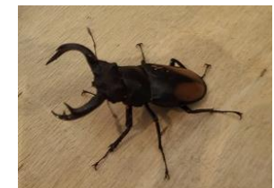
セアカフタマタクワガタ