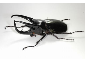
アトラスオオカブト