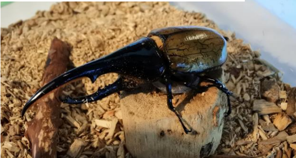
ヘラクレスオオカブト