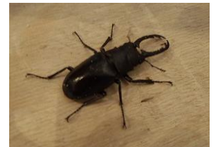
ギラファノコギリクワガタ