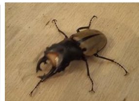
ルデキンギツヤクワガタ