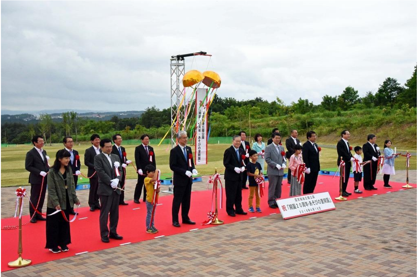
開園20周年及びあそびの里開園記念式典 6月16日撮影

こくえいえちごきゅうりょうこうえん 国営越後丘陵公園では、平成30年6月16日(土)に新エリア「あそびの里」がオープンしました。